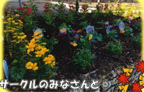
ボランティア、子育てサークルのみなさんと